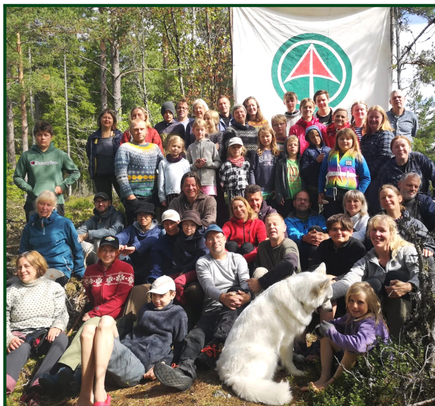
Argaladeis sommarläger 2023 i Flötemarken, Kynne Älv med många av deltagarna.

Styrelsen för Argaladei den 31 mars 2024